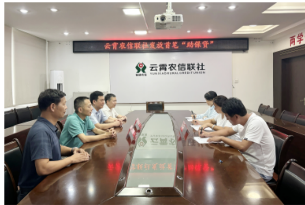
云霄县人社局联合云霄农信联社为群众发放了首笔“助保贷”现场