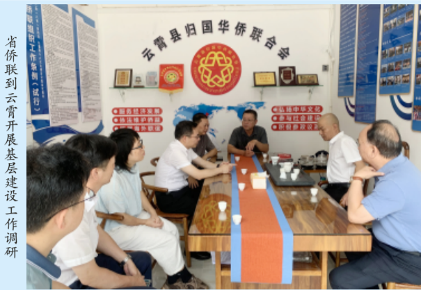
省侨联到云霄开展基层建设工作调研

本报讯 6月22日，福建省侨联党组成员、副主席、秘书长刘思一带队调研云霄县侨联工作。漳州市侨联副主席蔡春山，云霄县政协党组书记、副主席许师逊，云霄县侨联有关负责同志陪同调研。