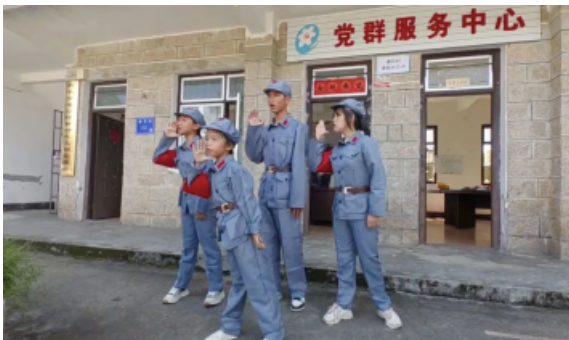
宣讲团以客家山歌为媒，让党的二十届三中全会精神“声”入民心

本报讯（何慧娟）客家山歌保留着纯正的客家语言本色，它是客家人心中的音乐图腾，每逢喜事盛事，人们总喜欢自编自唱的山歌来抒发情怀。8月2日，“福小宣·富民理响宣讲团”以山歌传唱的形式走进和平乡通贝村新时代文明实践站，开展“我在新时代文明实践中心做宣讲”。