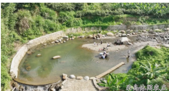
乐岛生态休闲农庄

午后时分，走进坐落在和平乡内洞村的乐岛生态休闲农庄，四周绿树阴翳，眼前一片波光粼粼，清凉感扑面而来。潺潺的溪水从山涧流淌过农庄，给这里增添了灵动气息。不少游客来到“岛”中戏水避暑，或在浅水池里踏水慢行、露营玩耍，或在片片“鱼